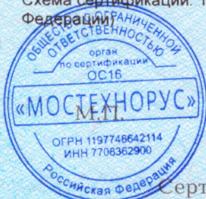
Схема сертификации: 1с (ГОСТ Р 53603-2020 Оценка соответствия. Схемы сертификации продукции в Российской Федерации)